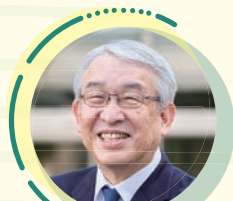
プログラムディレクター(PD)